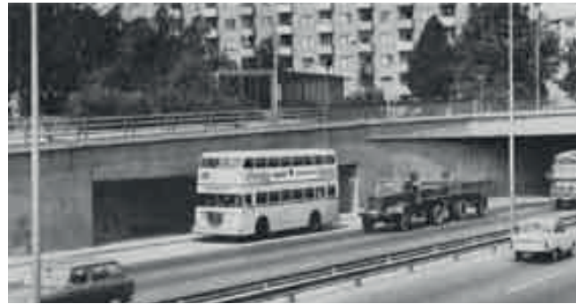
Stadtring: Weitsichtige Verkehrspolitik der SPD in den 50-ern

fehlte allerdings auch das Geld für einen Weiterbau. Im Zuge der notwendigen Vollendung des Stadtrings A 100 vom Wedding nach Pankow wäre dann ein Anschluß zur A 114 auszuführen. Vom BER führt noch ein kurzes Stummelstück vom Südosten Richtung Stadtgrenze. Diese